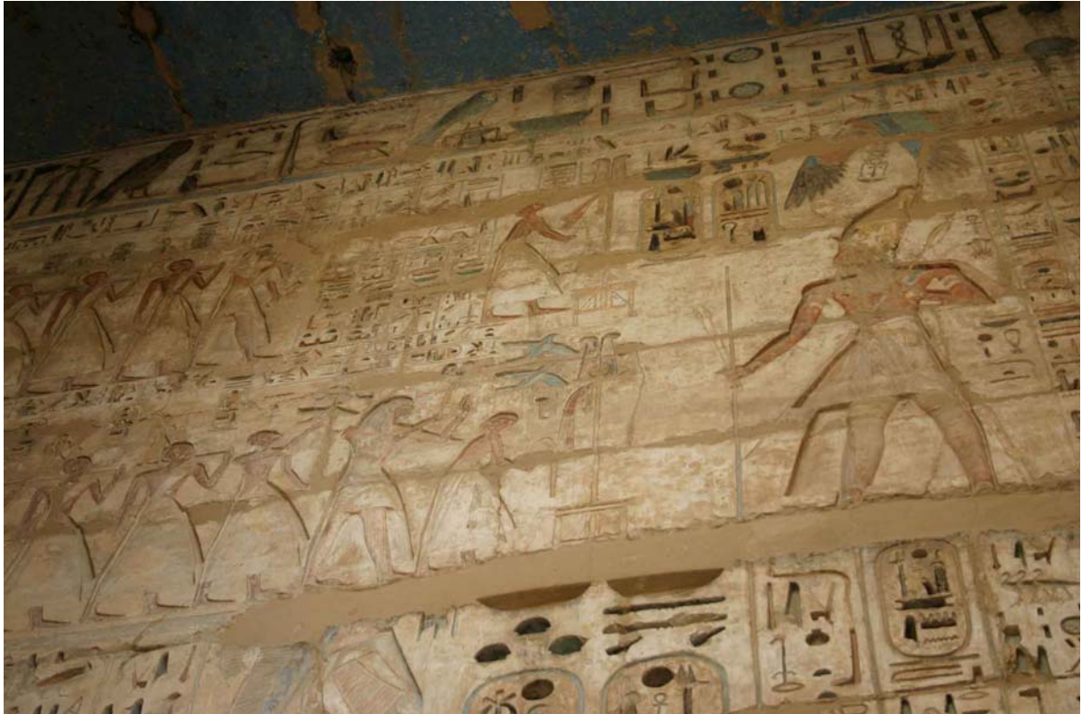
Reliefausschnitt aus Medinet Habu (blaue Tauben werden ausgesendet).

Das damals den Ägyptern unbekanntes Phänomen der Zugvögel, welche jeden Herbst von Süden nach Norden und jeden Frühling von Norden nach Süden zogen, mag der Grund dafür gewesen sein. Ebenso wie das Aussenden der Pfeile in allen vier Himmelsrichtungen Bestandteil eines Proklamationsrituals war (Verkündungsritual).